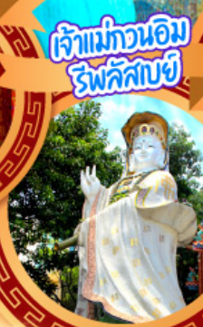
เจ้าแม่ทวนอิม วิฬาคีตบง