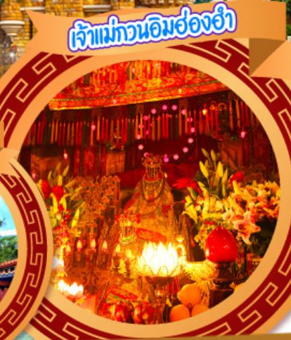
เจ้าแม่ทวนอิมฮ่องกง

05-08, 17-20 ต.ค., 31 ต.ค.-03 พ.ย.67 02-05, 07-10, 14-17, 16-19 พ.ย.67 21-24 พ.ย., 28 พ.ย.-01 ธ.ค.67