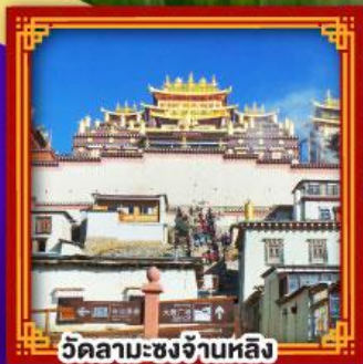
วัดลามะชงจ่านหลิง