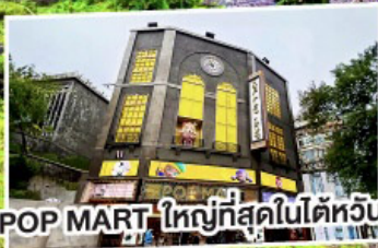
POP MART ใหญ่ที่สุดในไต้หวัน