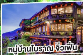
หมู่บ้านโบราณ จิวเฟิ่น