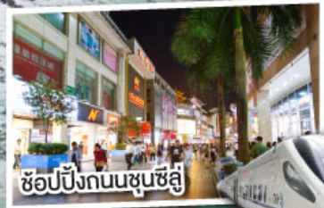
ช้อปปิ้งถนนชุนชี่