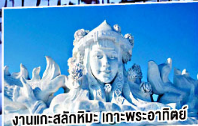
งานแกะสลักหิมะ เกาะพระอาทิตย์