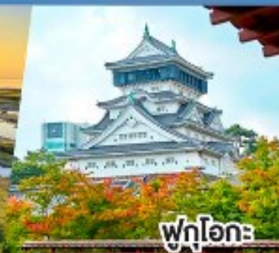
ฟูกูโอกะ