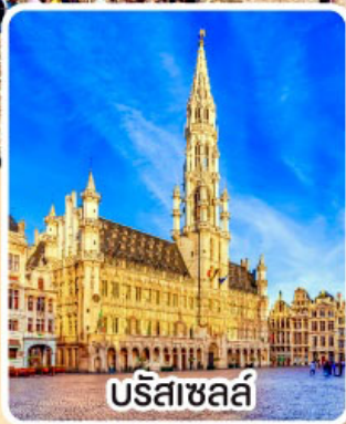
บรีซาเซล