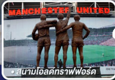
● สนามโอลด์แทรฟฟอร์ด