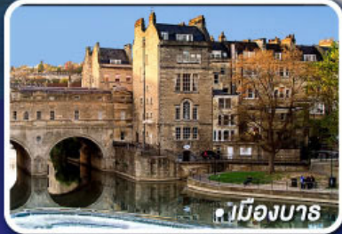
● เมืองบาส

● ถ่ายรูปสนามฟุตบอลแอนฟิลด์ สนามฟุตบอลโอลด์แทรฟฟอร์ด