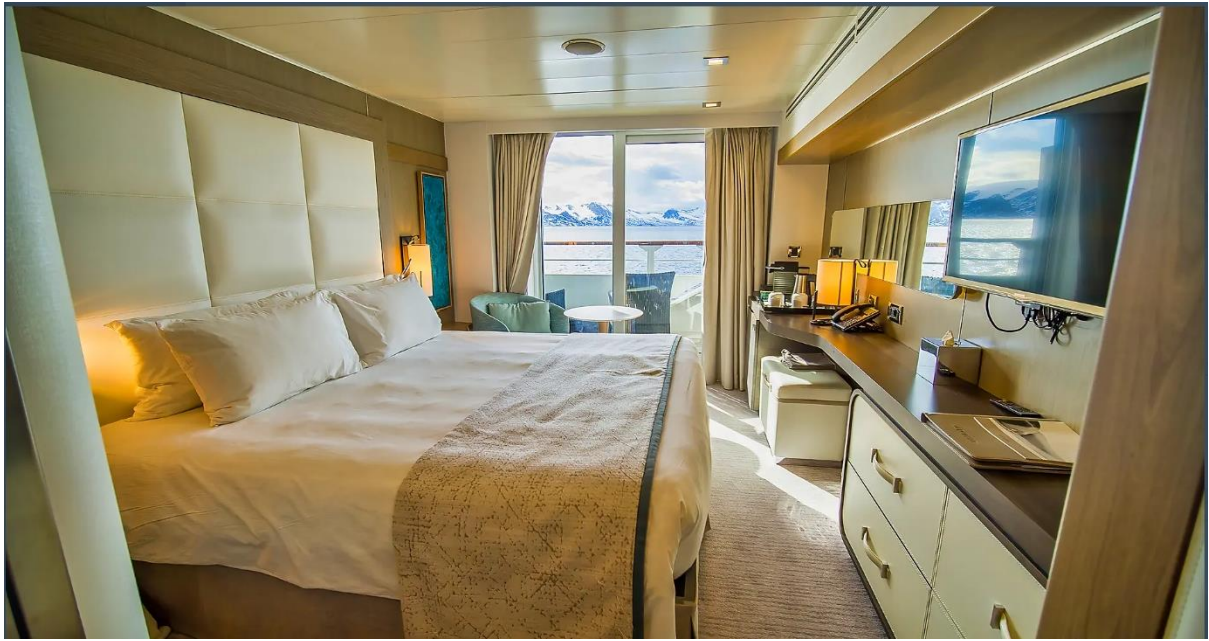
Deluxe Suite Deck