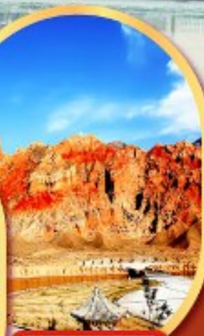
หุบเขาห้าสี อุทยานธรณีกุยเต๋อ