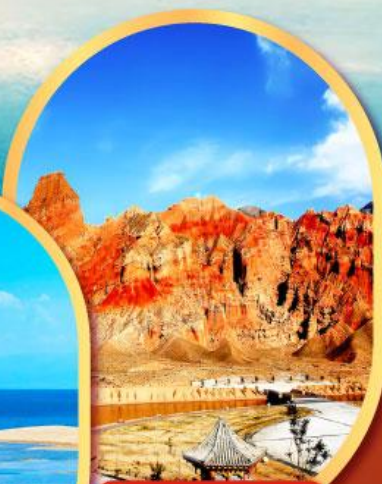
หมู่บ้านฮานี่กู่ยี้ต้อ