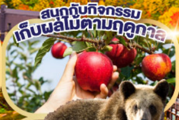
สนุกกับกิจกรรม เก็บผลไม้ตามฤดูกาล