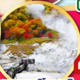
หุบเขานรกจิทอกุดานิ