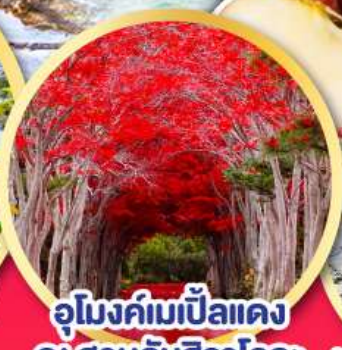
อุโมงค์ไม้แป้นแดง ณ สวนลับฮิราโอกะ