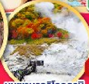
หุบเขานรกจิกุกุคาบิ