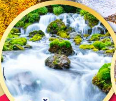
สัมผัสน้ำแร่ธรรมชาติ ณ สวนฟูทาคาชิ