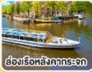
ล่องเรือหลังคากระจก

พิเศษ!! เมนูหอยแมลงภู่อบไวน์ขาว ล่องเรือหมู่บ้านไรกันน ที่รูน