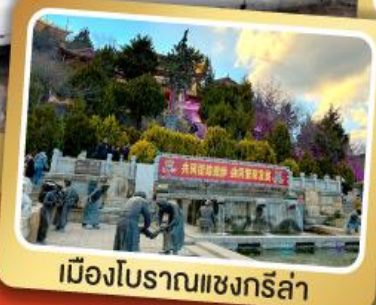
เมืองโบราณแชงกรี่ล่า