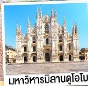
มหาวิหารมิลานดูโอโม

เมนูพิเศษ! หอยเอสคาโก้ อาหารไทย, ฟองดูซีส