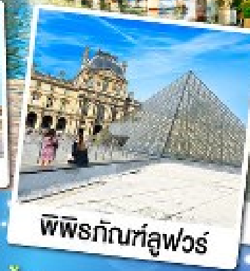
พีระมิดที่ลูฟวร์