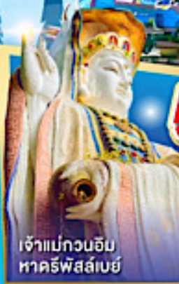
เจ้าแม่กวนอิม หาคีรีพิสัย