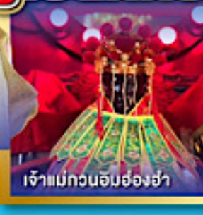
เจ้าแม่กวนอิมฮ่องซ่า