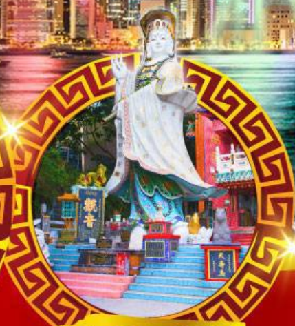
เจ้าแม่กวนอิม ทาครีฟส์ลีย์