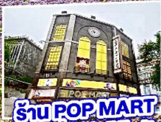
ร้าน POP MART ใหญ่ที่สุดในไต้หวัน