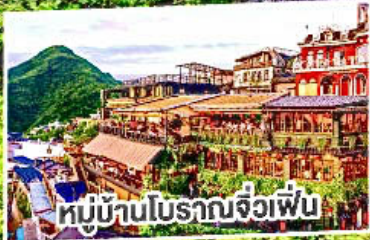
หมู่บ้านโบราณจื่อเฟิน