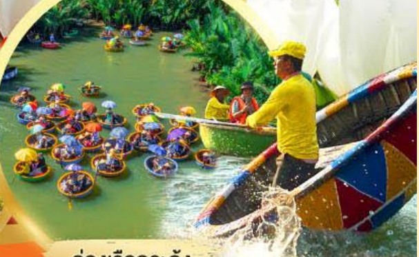
ล่องเรือกระดิง