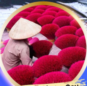
หมู่บ้านรูป Phu Cau