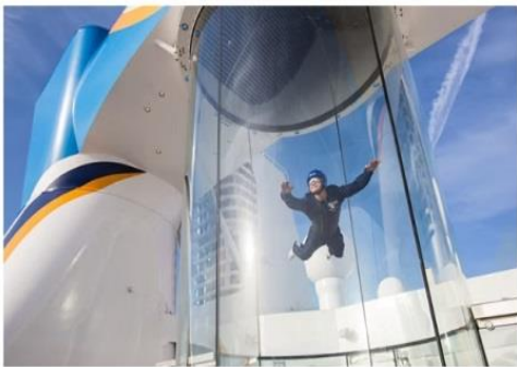
RIPCORD® BY IFLY®