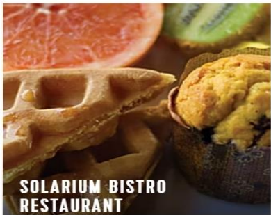
SOLARIUM BISTRO RESTAURANT