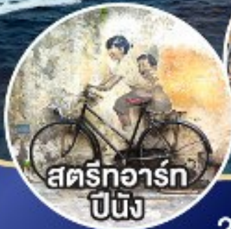
สตรีทอาร์ต ปีนัง