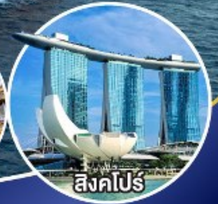
สิงคโปร์