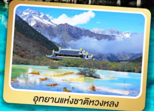
อุทยานแห่งชาติหลวงหลอง