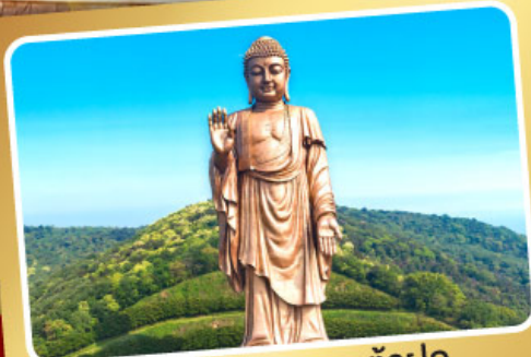
พระใหญ่หลังซานต้าฝอ