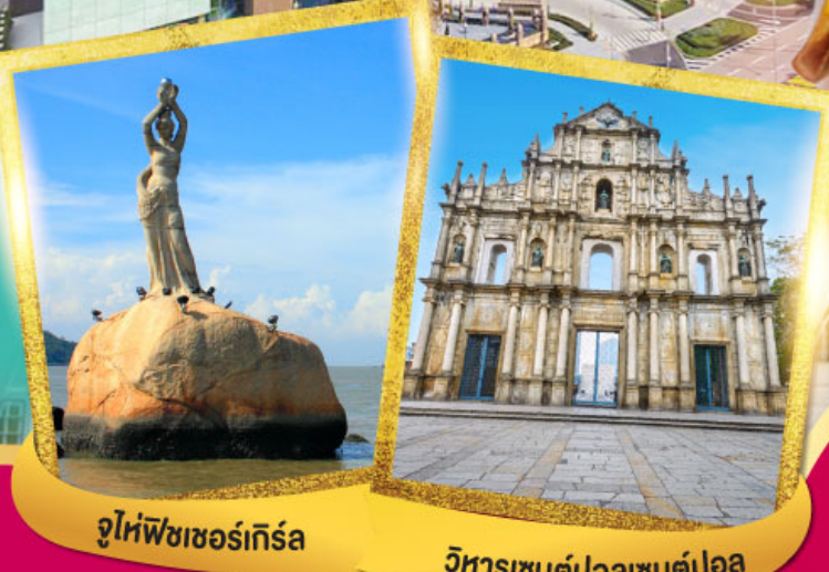
จูไห่ฟิชเชอร์เกิร์ล