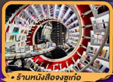
• ร้านหนังสือจุงชูก่อ