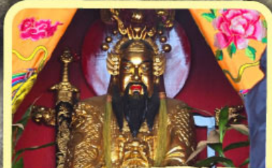
• เอียงบู๊ซิว (ศาลเจ้าพ่อเสือ)