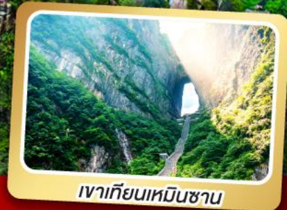
เวาเทียนเหมินชาน

ทริปเดียวเที่ยว 2 เมืองโบราณ ฝูหรงและเฟิ่งหวง ลัมรส สุกี้เห็ด บั๊อย่างเกาหลี เปิดปักษ์