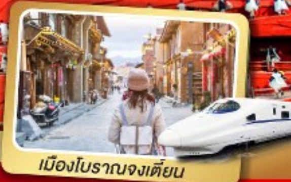
เมืองโบราณจงเตี้ยน