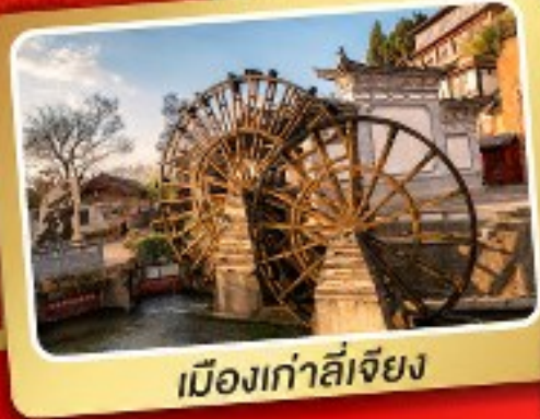
เมืองเก่าลี่เจียง