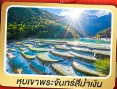
หุบเขาพระจันทร์สีน้ำเงิน