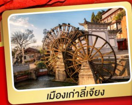
เมืองเก่าลี่เจียง