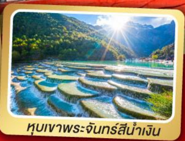
หุบเขาพระจันทร์สีน้ำเงิน