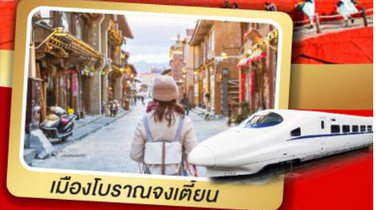
เมืองโบราณจงเตี้ยน