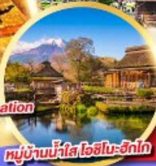
หมู่บ้านน้ำใส โอชิโนะฮัทสึ