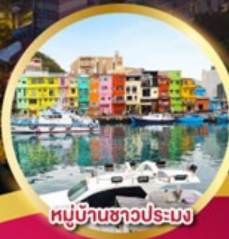
หมู่บ้านชาวประมง