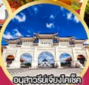
อนุสาวรีย์เจียงไคเช็ค