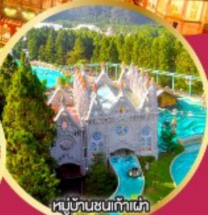
หมู่บ้านชนเก้าเผ่า