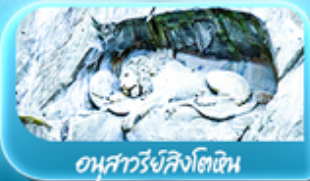
อนสาวรีย์สิงโตหิน