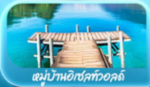
หมู่บ้านอิเชิลทออลด์