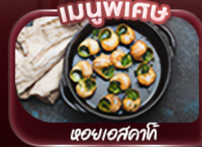
ผอชออสคาโก้