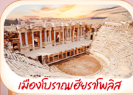
เมืองโบราณฮิยราโพลิส