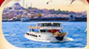
ช่องแคบบอสฟอรัส