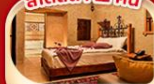
คัปปาโดเกีย