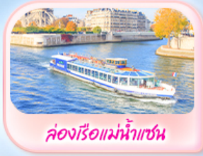
ล่องเรือแม่น้ำแซน