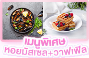
เมนูพิเศษ หอยมัสเซล+วาฟเฟิล

เยอรมัน เนเธอร์แลนด์ เบลเยียม ฝรั่งเศส Keukenhof