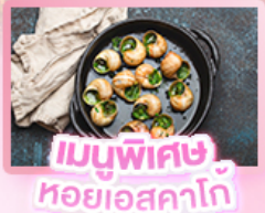
เมนูพิเศษ หอยเอสคาโกต์

19-26 มี.ค. / 20-27 มี.ค. / 3-10 เม.ย. / 12-19 เม.ย. / 29 เม.ย.-6 พ.ค. / 30 เม.ย.-7 พ.ค. / 1 - 8 พ.ค.68