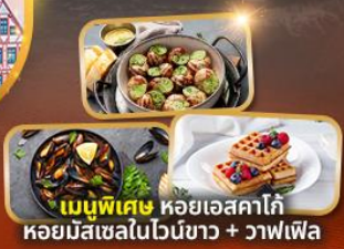
เมนูพิเศษ หอยแครงคาโก้ หอยมัสเซลไวน์ขาว + วาฟเฟิล

เมืองแฟรงก์เฟิร์ต จตุรัสโรเมอร์ มหาวิทยาลัยเมืองโคโลญ นั่งเรือชมหมู่บ้านทึร์นัม เกี่ยวหมู่บ้านกังหันลม ล่องเรือคลองอัมสเตอร์ดัม เมืองเคนต์ มหาวิทยาลัยเซนต์บาโ เมืองบรัสเซลส์ อะโตเมียม รูปปั้นแมนิเคนพีส เมืองบรูคส์ เมืองปารีส หอไอเฟล ลูฟวร์ ประตูชัย ล่องเรือแม่น้ำแซน