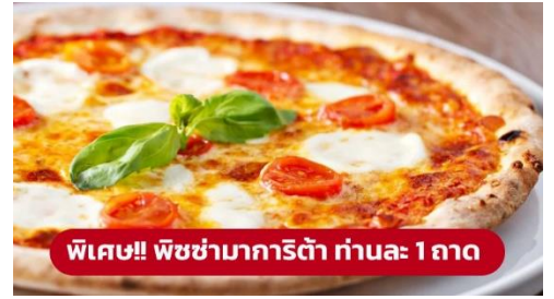
พิเศษ!! พิซซ่ามาการิตต้า ท่านละ 1 ถาด

ที่พัก: Novotel Venice Mestre Castellana หรือระดับใกล้เคียงกัน (ชื่อโรงแรมที่ท่านพักทางบริษัทจะทำการแจ้งพร้อมใบนัดหมาย 5-7 วัน ก่อนวันเดินทาง)