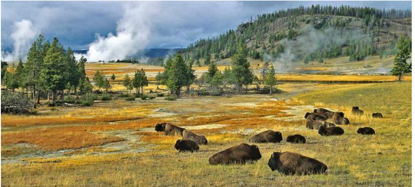
ใกล้เคียง

วันที่ห้าของการเดินทาง(5) เวสต์ เอลโล่ สโตน - อุทยานแห่งชาติแกรนด์ทีทอน เชียนบัฟฟาโล่ บิลด์ - เมืองโคดี้