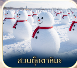
สวนตุ๊กตาหิมะ