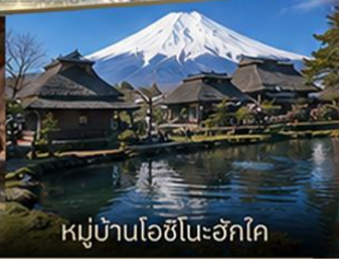
หมู่บ้านโอชิโนะฮักโค