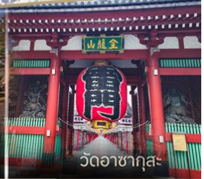
วัดวาคายากุสะ