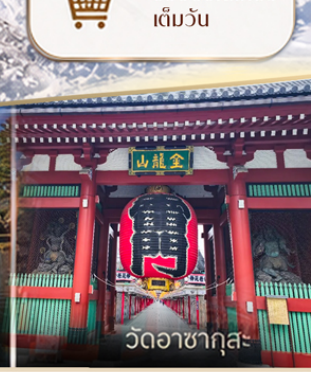
โทเกมมะเอาก์เล็ท