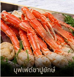
บุฟเฟ่ต์ซาปูยักซ์