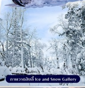
ภาพวาดน้ำแข็ง Ice and Snow Gallery