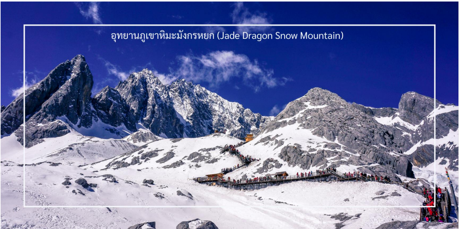
อุทยานภูเขาหิมะมังกรหยก (Jade Dragon Snow Mountain)

การท่องเที่ยวบริเวณภูเขาหิมะมังกรหยกนั้น ถือเป็นจุดที่มีออกซิเจน ที่เบาบางมาก รวมไปถึงระดับความสูง ที่มีอากาศหนาวเย็นและลมแรง ควรเตรียมร่างกายของท่านให้พร้อม และปฏิบัติตามคำแนะนำของไกด์ท้องถิ่น และหัวหน้าทัวร์อย่างเคร่งครัด และควรมีกระป๋องออกซิเจนแบบพกพา เพื่อช่วยเหลือนักเดิน ในกรณีที่ท่านมีอาการแพ้ความสูงแบบเฉียบพลัน (หมายเหตุ: กรณีที่มีการประกาศปิดให้บริการกระเช้าไฟฟ้า อันเนื่องมาจากเหตุผลด้านสภาพอากาศไม่เอื้ออำนวย, การปิดซ่อมบำรุง, หรือเหตุผลใดๆ บริษัทผู้จัดขอสงวนสิทธิ์ในการปรับเปลี่ยนโปรแกรมท่องเที่ยวอื่นทดแทน หรือในกรณีที่กระเช้าใหญ่ปิด ทางบริษัทผู้จัด จะเปลี่ยนมาขึ้นกระเช้าเล็กยูนชันผิงแทน โดยไม่ต้องแจ้งให้ทราบล่วงหน้า)