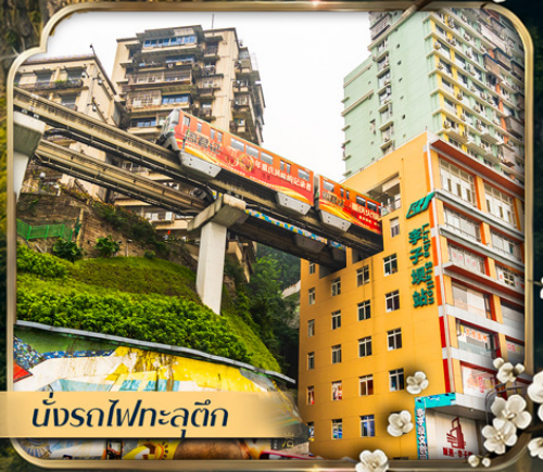
นั่งรถไฟกะลุดัก

✈️ คอนเฟิร์มออกเดินทาง ตั้งแต่ 10 ท่าน ขึ้นไป