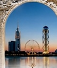
บาทุมิ BLACK SEA BOULEVARD