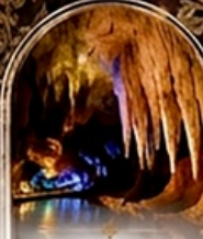
ดำโพรมิริอัส BOAT RIDE

เดินทางช่วงปีใหม่ 27 ธ.ค. - 3 ม.ค. 70 ราคาเพียง 75,989 บาท / ท่าน