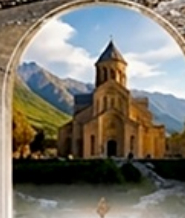
มัทสเคต้า UNESCO HERITAGE