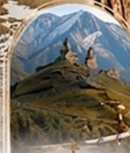
คาสเบกี 4WD EXPERIENCE