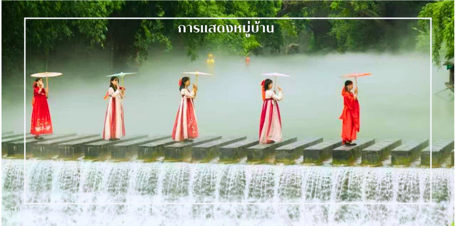
การแสดงหมู่บ้าน

นำท่านสู่ หมู่บ้านซานเซียเหรินเจีย (Sanxia Renjia) (รวมล่องเรือ) สถานที่นี้เป็นที่รู้จักกันในชื่อ หมู่บ้านสามผา แหล่งท่องเที่ยวระดับ 5A ตั้งอยู่ในเขตหุบเขาสามผา ริมน้ำแยงซีเกียง โดดเด่นด้วยทัศนียภาพทางธรรมชาติอันงดงามของภูเขาหินผา สายน้ำ และหุบเขาที่โอบล้อมกันอย่างกลมกลืน สถานที่แห่งนี้สะท้อนวิถีชีวิตดั้งเดิมของชาวลุ่มแม่น้ำแยงซีเกียง ผ่านสถาปัตยกรรมพื้นบ้าน วัฒนธรรม ประเพณี ที่ยังคงเอกลักษณ์ไว้อย่างครบถ้วน พร้อมให้ท่านได้ชมการแสดงเรื่องราวเกี่ยวกับวิถีชีวิตควบคู่กับสายน้ำ