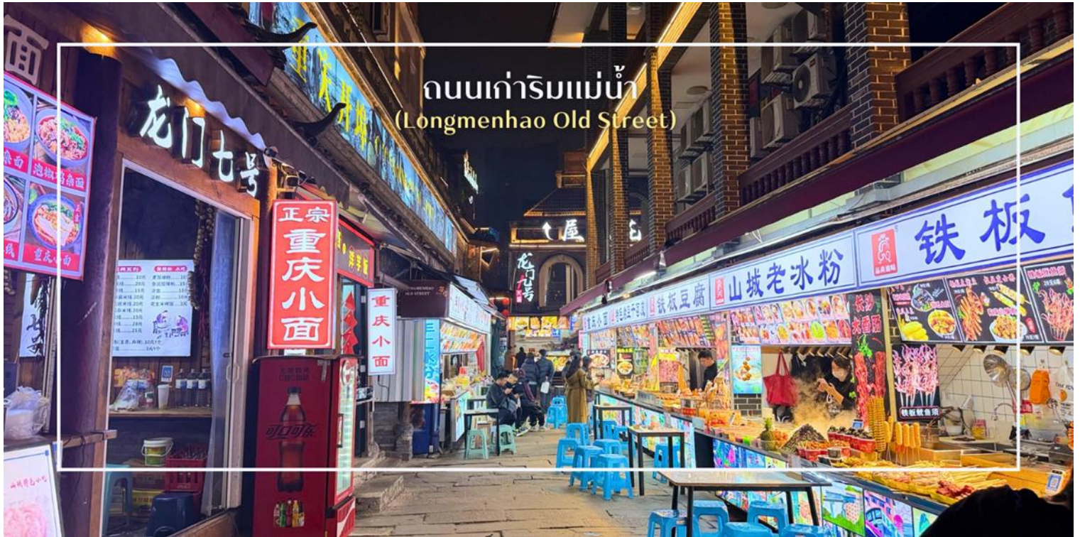
ถนนเก่าริมแม่น้ำ (Longmenhao Old Street)

เย็น บริการอาหารเย็น ณ ภัตตาคาร (มื้อที่ 9) เมนูพิเศษ : สุกี้หม่าล่า