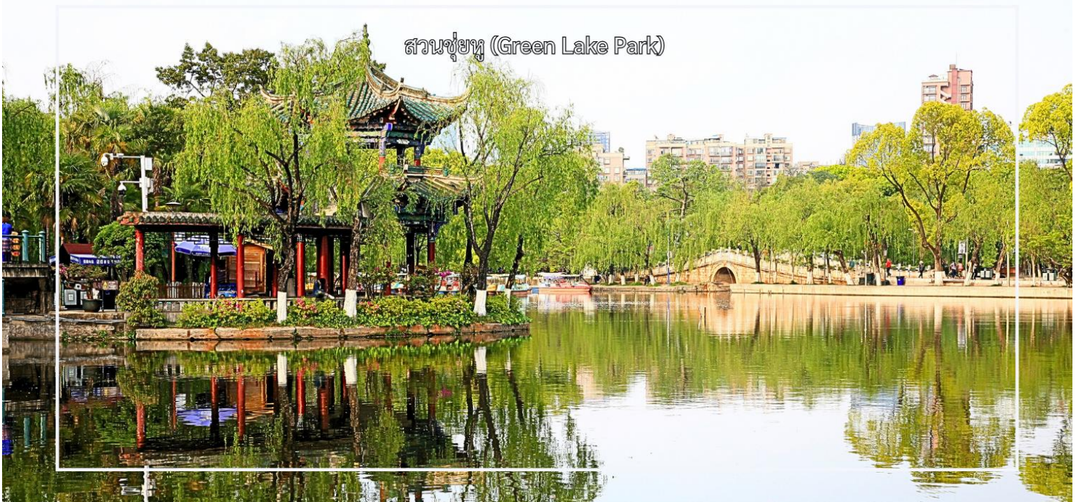
สวนชู่หู (Green Lake Park)

จากนั้นนำท่าน ชมทิวทัศน์ภาพ สวนชู่หู (Green Lake Park) เป็นสวนสาธารณะใจกลางเมืองคุนหมิงที่มีชื่อเสียงและได้รับความนิยมอย่างมาก โดดเด่นด้วยทะเลสาบสีเขียวมรกตที่โอบล้อมด้วยต้นไม้ร่มรื่น และบรรยากาศผ่อนคลาย เหมาะแก่การพักผ่อนและเดินเล่น สวนแห่งนี้เป็นศูนย์รวมวิถีชีวิตของชาวคุนหมิง นักท่องเที่ยวสามารถชมกิจกรรมท้องถิ่น สัมผัสบรรยากาศธรรมชาติ และถ่ายภาพความสวยงามของสวนในทุกฤดูกาล