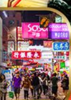
Shopping Tsim Sha Tsui