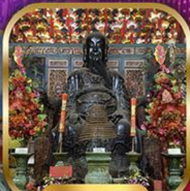
วัดปึกใต้