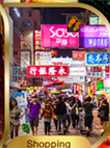
Shopping Tsim Sha Tsui