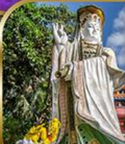
เจ้าแม่กวนอิม สวีลิสเบย์