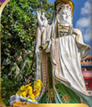
เจ้าแม่กวนอิม รับลิสสมัย