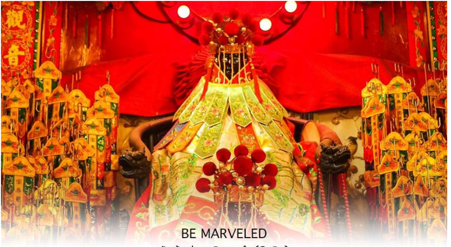
BE MARVELED วัดเจ้าแม่กวนอิมฮวงอ้า (ยิมเิน)

นำท่านชม ศูนย์ฮวงจู้ย กังหันเศรษฐี ที่ขึ้นชื่อของฮ่องกง ท่านจะได้พบกับงานดีไซน์ที่ได้รับรางวัลยอดเยี่ยม และใช้ในการเสริมดวงเรื่องฮวงจู้ย ศูนย์ฮวงจู้ยกังหันเศรษฐี วัดแชกง" ไม่ใช่ชื่อวัดโดยตรง แต่เป็นชื่อที่เกี่ยวข้องกับ วัดแชกงหมิว (Che Kung Temple) ในฮ่องกง ซึ่งเป็นที่รู้จักกันดีในเรื่อง กังหันนำโชค ที่เชื่อว่าสามารถหมุนปิดเป่าสิ่งชั่วร้ายและนำโชคลาภเข้ามาในชีวิต