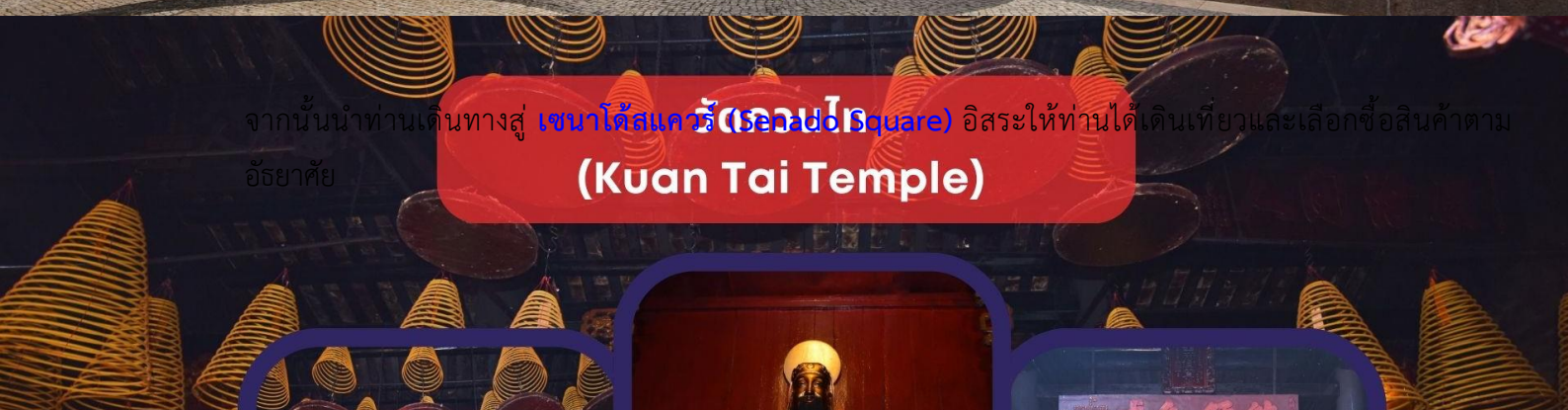
กวนไตเทมเปิล (Kuan Tai Temple)

จากนั้นนำท่านเดินทางสู่ เซนาโดสแควร์ (Senado Square) อิสระให้ท่านได้เดินเที่ยวและเลือกซื้อสินค้าตามอัธยาศัย