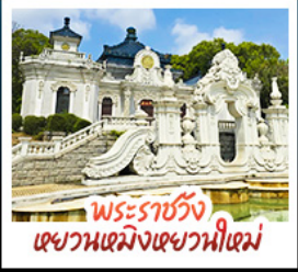
พระราชวัง เฉยวนเฉยฉางเฉยวนใหม่