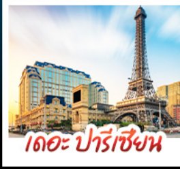
เดอะ ปารีสเซียน

สัมผัสบรรยากาศ เดอะ เวนเซียน มาเก๊า เสมือนได้เยือนลาสเวกัส ชมความวิจิตรตระการตาของพระราชวังหยวนหมิงหยวนใหม่แห่งจูไห่ เช็กอินกับแลนด์มาร์กสุดฮิตจตุรัสสวาเอ็งถ่ายรูปลูกบ่อทีวีของกวางเจา เที่ยวชมหมู่บ้านสไตล์ยุโรปแห่งใหม่ของเซนจิน • ช้อปปิ้งเพลิน ๆ ที่ห้างสรรพสินค้า COCO PARK ถนนคนเดินฟู้หวู่หลี่และถนนคนเดินบิกกิง