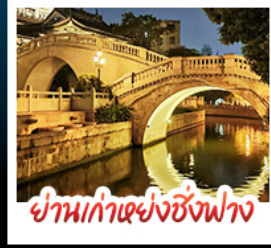
ย่านเก่าแห่งซิงฟาง