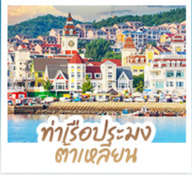
ทำเรือประมง ต้าเหลียน