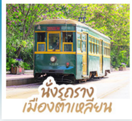
นั่งรถราง เมืองต้าเหลียน