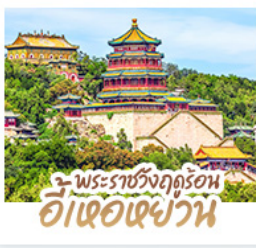
พระราชวังฤดูร้อน อี่ถงเหอเป่ย์