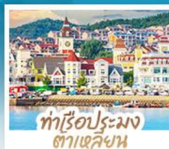
ท่าเรือประมง ต้าเหลียน