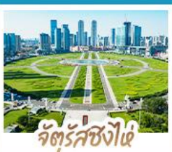
จัตุรัสชิงไฉ่